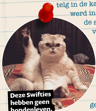
Deze Swifties hebben geen hondenleven.

Taylor Swift heeft niet alleen een kast vol Grammy's, maar ook drie pluizige miljonairs rondlopen: katten Olivia Benson, Meredith Grey, en Benjamin Button. Olivia spant de kroon met een vermogen van maar liefst 97 miljoen dollar, mede dankzij haar commerciële werk als actrice. Benjamin, de jongste telg in de kattenfamilie, werd in 2019 ontdekt op de set van Taylors videoclip 'Me!' en spinde zich direct in haar hart. Meredith houdt het allemaal wat relaxter, maar dat betekent niet dat ze minder geniet van haar luxe leventje. Of ze nu loungen op fluwelen kussens in privéjets of flaneren in New York, één ding is duidelijk: deze katten hebben het beter voor elkaar dan de meeste mensen.