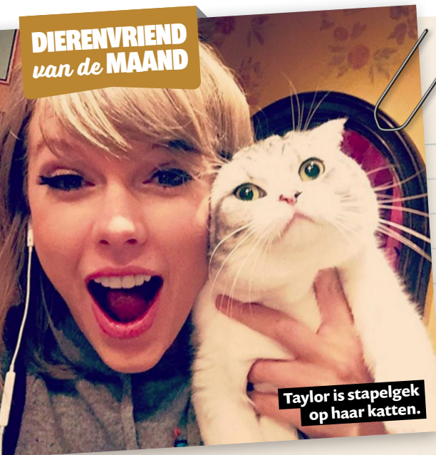
Taylor is stapelgek op haar katten.