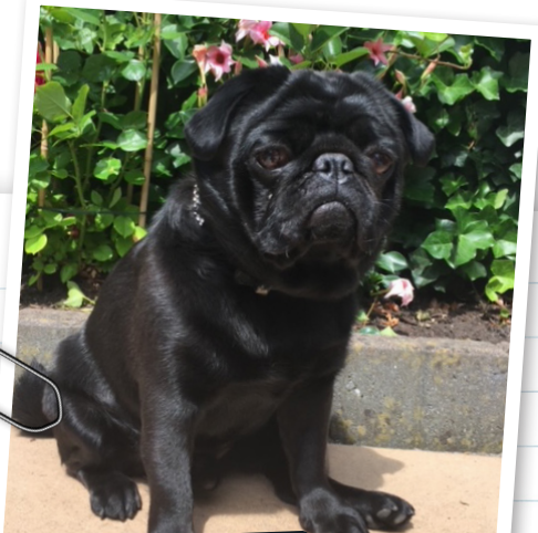
Mijn hond heet